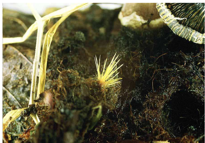
Frisch sprießendes Ozonium